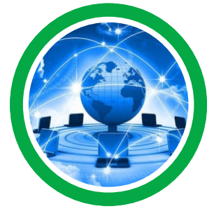
Redes Cableadas WIFI