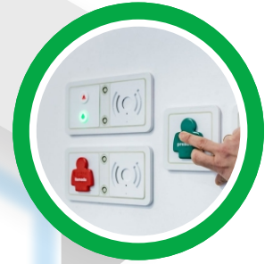
Sistemas de Llamado de Enfermeras